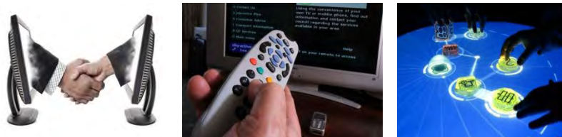
Figura 1: Imágenes relacionadas con una visión preliminar del concepto de interactividad

Ahora avancemos un poco sobre esta idea, si focalizamos esta actividad de comunicación entre persona y una aplicación informática: