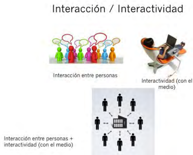
Figura 3: Diferencias entre interacción e interactividad

La Figura 3 ejemplifica algunas de estas diferenciaciones conceptuales abordadas hasta aquí.