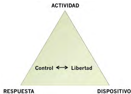
Figura 2: Componentes iniciales de interactividad, en la tensión libertad-control

Podríamos llegar entonces a una definición preliminar de interactividad como la que sigue: “Es la capacidad de respuesta de un medio (receptor) para modificar su funcionalidad o mensaje a partir de las decisiones de control de una persona o grupo de personas (emisor/es), dentro de los límites de su lenguaje y diseño”.