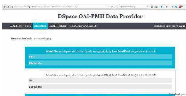
Fig 2. El protocolo OAI-PMH en el repositorio digital DSpace.

Y responde con todos sus registros. Por ejemplo, en la siguiente imagen se utilizan los estilos de Lyncode[15] para brinda una interfaz más amigable, que se presenta en la figura 2.