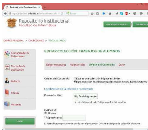
Fig 3. Cosechando en el repositorio digital DSpace.

Luego, para realizar una cosecha desde un Meran al repositorio digital es necesario configurar una colección específica donde se guardarán los metadatos solamente, o también es posible configurar metadatos y referencias a los archivos o recolectar metadatos y ficheros. En la figura 3 se ilustra la configuración de la cosecha en Dspace.