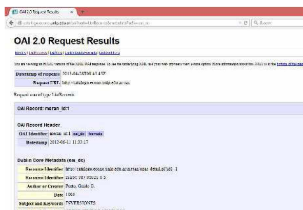
Fig. 5 – Ejemplo de implementación del módulo OAI-PMH en el catálogo de la Facultad de Ciencias Económicas de la UNLP

Obteniendo el resultado que se presenta en la figura 5: